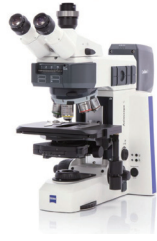
Axio Examiner, Primo, Axio Imager, Axiolab, Axioscope等